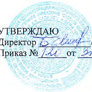
График оценочных процедур в 1—11-х классах на 2023/24 учебный год